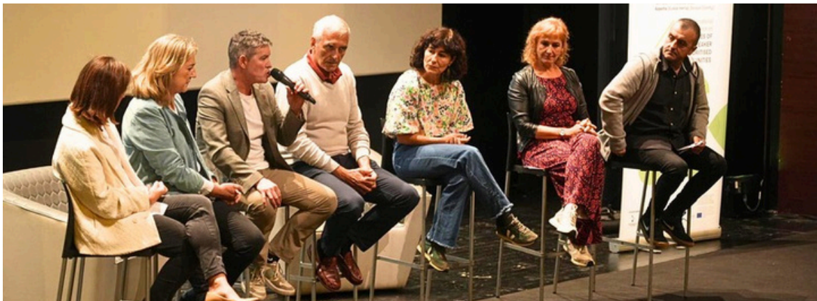
Konferentzia antolatu eta babestu zuten erakundeetako ordezkariak hartu zuten hitza konferentziaren hasieran: Azpeitiko Udala, Gipuzkoako Foru Aldundia, Eusko Jaurlaritza, Coppieters Fundazioa, Udako Euskal Unibertsitatea, Soziolinguistika Klusterra eta UEMAko ordezkariak, zehazki.