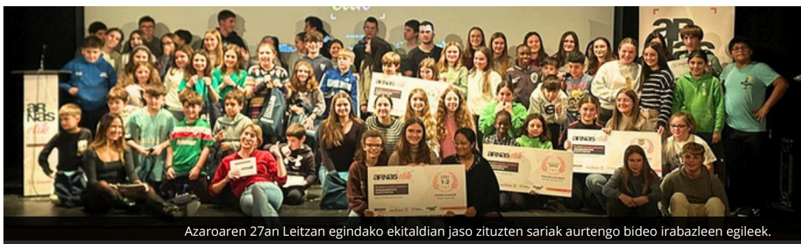
Azaroaren 27an Leitza Herri Aretoan egindako ekitaldian jaso zituzten sariak aurten bideo irabazleen egileek.

Horien guztien artean, Baliarrain, Leitza eta Mutrikuko ikasleen lanak saritu ditu aurten epaimahaiak. Guztira 3.583 boto jaso dituen publikoaren saria, berriz, Berriatuako ikasleek jaso dute. Azaroaren 27an banatu zituzten sariak, Leitza Herri Aretoan egindako ekitaldian.