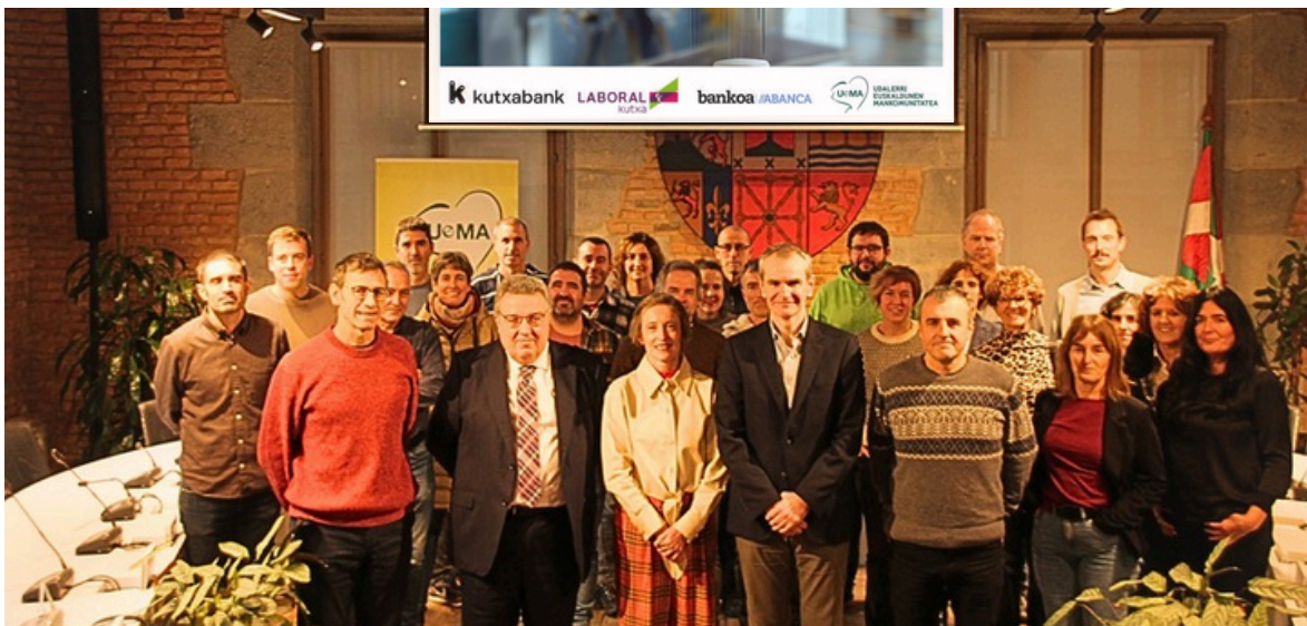
Azaroaren 20an Tolosan egin zuten hitzarmena sinatzeko eta aurkezteko ekitaldia. UEMArekin batera, bertan izan ziren Laboral Kutxa, Kutxabank eta Bankoa ABANCAko ordezkariak, eta hiru finantza erakunde horien bulegoak dituzten 59 udalerrri euskaldunetako alkateak eta zinegotziak.