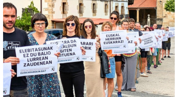
Herriz herri, kartelak eskuetan hartuta, epaia salatzen hainbat leku erakutsi zituzten milaka lagunek. Argazkian, Bakaikoko elkarretaratzea.