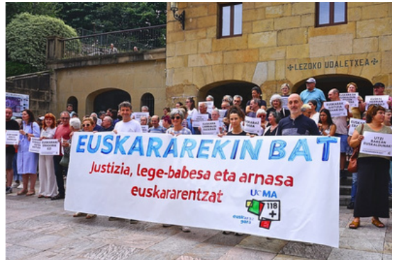
UEMAREN deialdiarekin propio prestatutako pankartak erakutsi zituzten herriz herri askotan. Argazkian, Lezoko udal ordezkariak, herritarrekin batera.

Handik bost egunera, berri, berrehundik gora alkatek eta udal ordezkariak salatu zuten epaia Bilbon, Euskalgintzaren Kontseiluak deituta. EAEko Justizia Auzitegi Nagusiaren egoitzaren aurrean egin zuten agerraldia, eskuetan aginte makilak eta zumeak zituztela, epaia euskal erakundeen erabaki demokratikoaren aurkakoa ere badela salatzen.