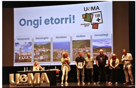
Donamaria, Ormaiztegi, Mutiloa, Ibarangelu eta Mundakako alkateak, maiatzean, UEMAko kide bihurtu ziren egunean.

17 udalekin ekin zion bideari UEMAk 1991n, eta 2023an gainditu zuen 100 udalen langa. Harrezkero beste 20 udal gehitu dira, azken bi urteotan.